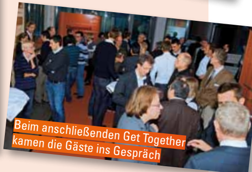
Beim anschließenden Get Together kamen die Gäste ins Gespräch