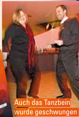
Auch das Tanzbein wurde geschwungen