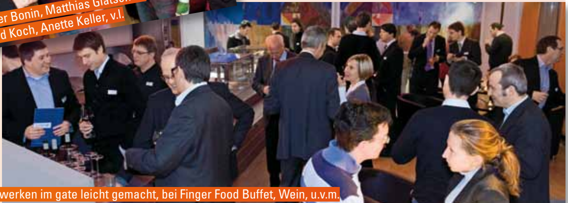
Netzwerken im gate leicht gemacht, bei Finger Food Buffet, Wein, u.v.m.